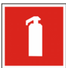
Знак, обозначающий, что в данном месте находится огнетушитель