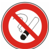
Знак, запрещающий курение