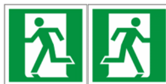
Знак, указывающий направление выхода